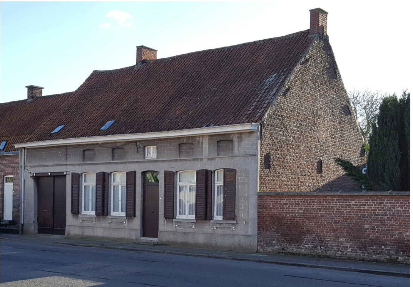
Zo zag het vroegere café De Kloefkapperij er uit in 2018

Het huis wordt in februari 2026 gesloopt.