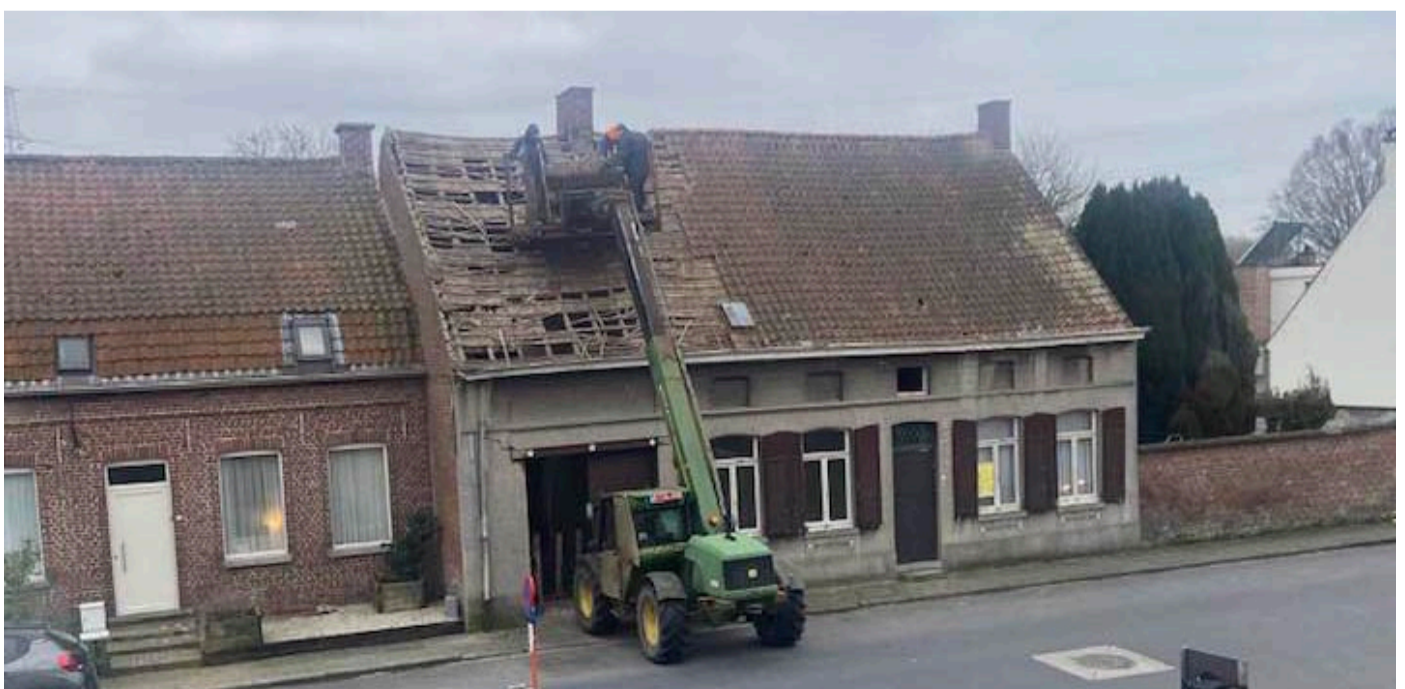
Februari 2026: aanvang van de afbraak van het vroegere café De Kloefkapperij.